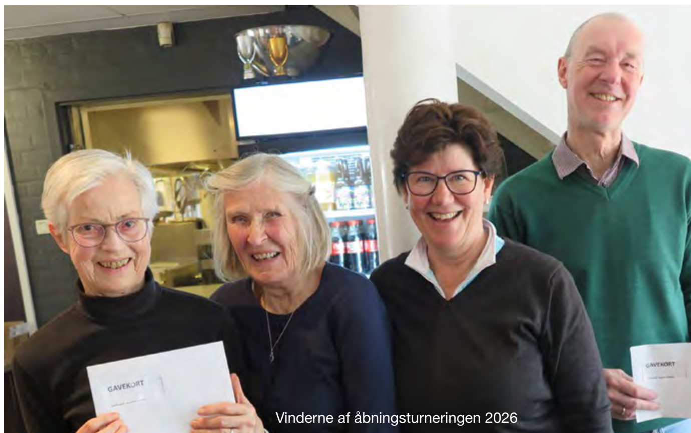
Vinderne af åbningsturneringen 2026

E fter en vinter, hvor selv Old Tigere måtte undvære golfspil på Toftegård i lange perioder på grund af sne og væde, er det klart, at mange nu er klar til at komme "på græs".